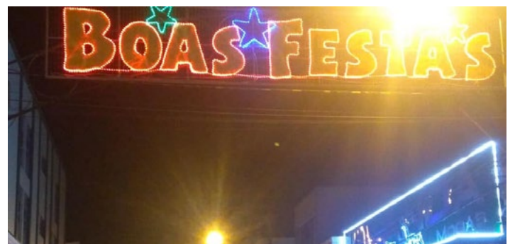
Decoração e iluminação natalina nas ruas centrais do município