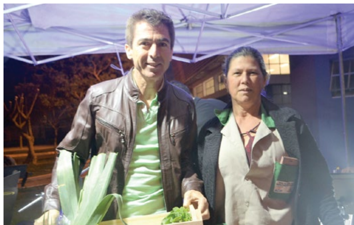
Presidente da ACIP recebe cesta de verduras e legumes

Esta iniciativa fortalece os agricultores locais, fomenta a economia do município e contribui com algumas entidades filantrópicas. Temos a certeza de que esta ação continuará por muitos anos”, destaca o presidente da ACIP.