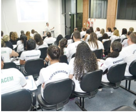
Alunos de enfermagem participaram da palestra