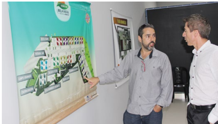
Representante da Bela Vista apresenta informações do condomínio ao presidente da ACIP

A apresentação do Condomínio Quinta da Bela Vista ocorreu no dia 13 de novembro, no Plantão de Vendas da Bela Vista. O objetivo do evento era exibir o decorado do empreendimento aos presentes. “São 192 apartamentos, portaria 24 horas, área de lazer, campo gramado, academia ao ar livre,