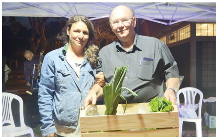
Diretor de Eventos recebe cesta de verduras e legumes