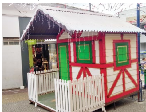
Casinha do Papai Noel instalada no Calçadão