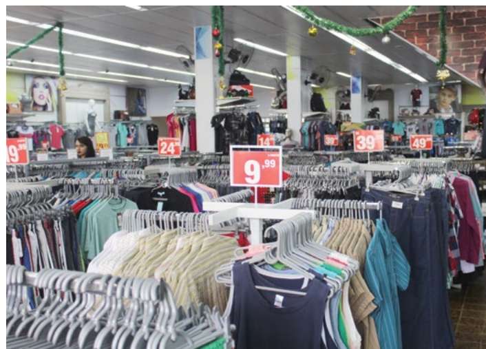
Loja oferece variedades no segmento de roupas

São doze funcionários na unidade de Piedade e para a época do Natal, o quadro será ampliado por conta da expectativa de aumento no movimento. “Oferecemos ainda diversas promoções, parcelamento em até seis vezes sem juros no cartão ou crediário, distribuição de brindes, entre outras vantagens ao cliente”, finaliza o gerente. A Skala fica localizada na Rua Araújo Leite, 51, Centro. Outras informações podem ser obtidas pelo telefone 3244-2698.