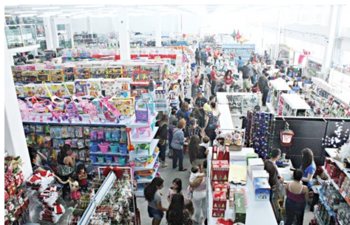
Inauguração conta com presença de muitos clientes

O horário de funcionamento é das 8h30 às 18h de segunda a sábado. A loja Kami está localizada na Rua Capitão Moraes, 160, Centro.