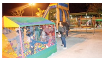
Brinquedos fazem a alegria da criançada