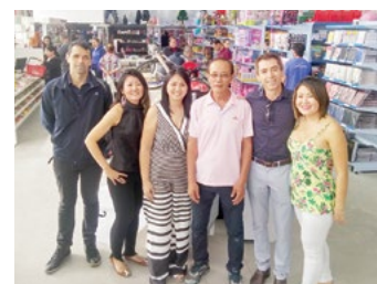
Representantes da ACIP com os proprietários da loja