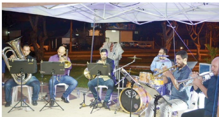
Sexteto de Metais Lira São João