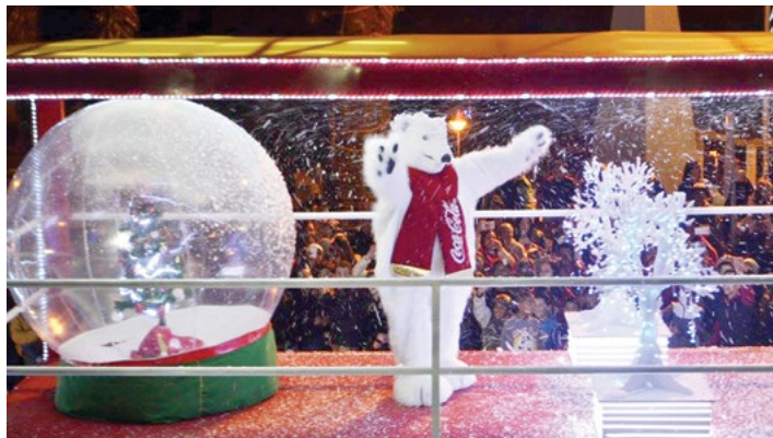
Caravana contará com Urso Polar, Mamãe e Papai Noel

A Caravana de Natal da Coca-Cola estará em Piedade no dia 14 de dezembro com os tradicionais caminhões iluminados e os personagens Urso Polar, Mamãe e Papai Noel. O ponto de saída da Caravana será no Portal das Águas, às 21h30. A data para a realização do evento foi agendada pela Sorocaba Refrescos, idealizadora desta ação, que conta com apoio da Prefeitura e Associação Comercial e Industrial de Piedade (ACIP).