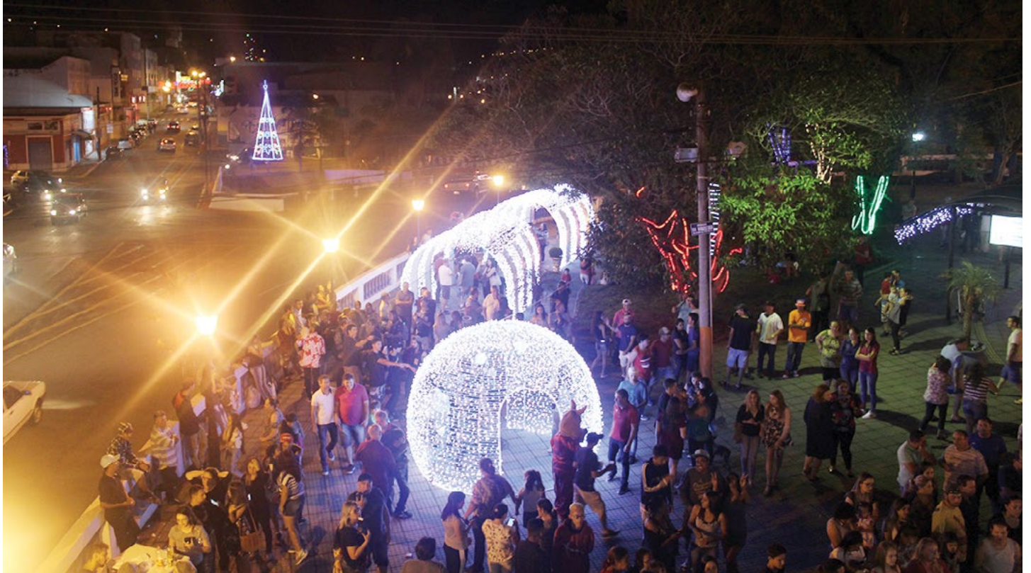
Inauguração da Iluminação de Natal realizada na Praça da Bandeira atrai grande público

A iluminação de natal de 2018 foi planejada em parceria entre Prefeitura de Piedade e Associação Comercial e Industrial de Piedade (ACIP).