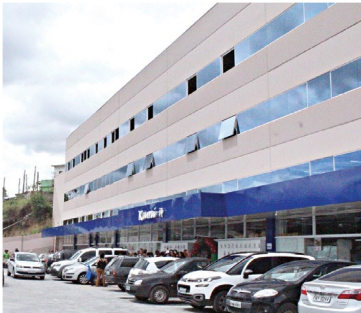
Nova loja oferece espaço para estacionamento

A Kami inaugurou no início de novembro uma ampla loja em novo endereço. A empresa, que está há 13 anos em Piedade, decidiu investir em um espaço com mais comodidade para os clientes e colaboradores.