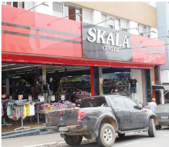
A Skala fica localizada na Rua Araújo Leite, 51, Centro

O período do ano que gera mais expectativa nos comerciantes é o Natal. O mês de dezembro aquece as vendas por conta das tradicionais comemorações festivas de fim de ano. Para a loja Skala, pertencente ao segmento da moda e calçados, a expectativa é grande. “Acreditamos no potencial da cidade e o crescimento do município no geral tem superado nossas expectativas. O potencial agrícola de Piedade faz com que o comércio não seja afetado pela instabilidade econômica do país. É um local que tem muito a nos dar”, comenta André Pina, gerente da loja.