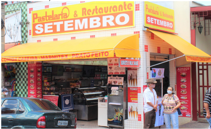
Pastelaria está localizada na R. Araújo Leite, ao lado do Mercado Municipal

A campanha foi um sucesso. Teve alcance de mais de 8.000 pessoas, 131 curtidas, 191 comentários e 107 compartilhamentos. A promoção também foi divulgada no Instagram @pastelariasetembro.