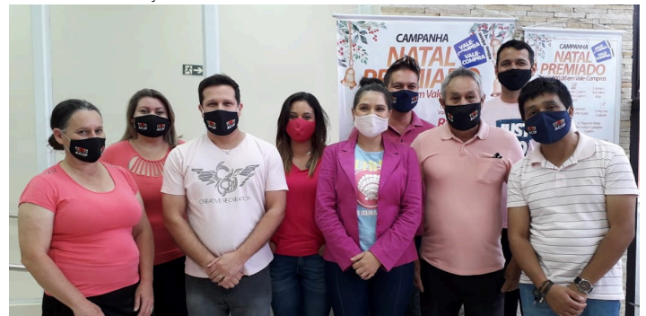
Equipe de colaboradores da ACIP