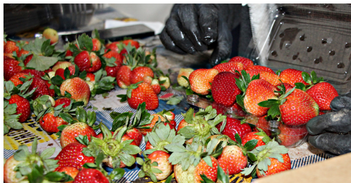
A fruta é vendida em grandes cidades e na região