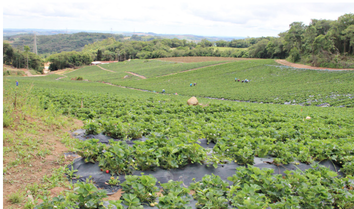
Plantio de morango ocupa área de 4,6 hectares em propriedade rural

Piedade é considerada uma das maiores produtoras de morango do Estado de São Paulo. O município possui cerca de 330 propriedades rurais que cultivam a fruta. Em 2019, a produção em solo piedadense foi de pouco mais de 2 mil toneladas. Para a safra deste ano, a previsão é de que a colheita possa chegar a 3 mil toneladas, de acordo com informações da Secretaria de Desenvolvimento Rural e Meio Ambiente.