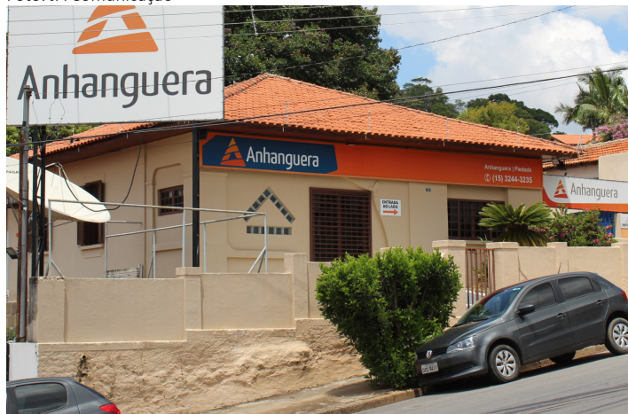
A faculdade está localizada na Rua Vinte e Um de Abril, 139 - Centro

A Faculdade Anhanguera de Piedade oferece a oportunidade de graduação no sistema Educação à Distância (EAD) em duas modalidades.