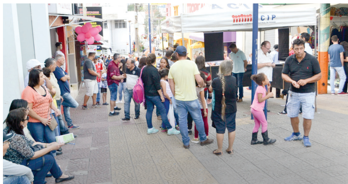
Sorteios serão realizados no Calçadão

A Associação Comercial e Industrial de Piedade (ACIP) vai sortear R$ 12.500,00 em vales-compra no dia 11 de agosto referente à Campanha “2018 dá Sorte”, em comemoração ao Dia dos Pais. Serão sorteados 15 vales-compra no valor de R$ 500,00 e um no valor de R$ 5.000,00. Os sorteios ocorrerão no Calçadão, a partir das 14h. Para participar, o consumidor deve fazer suas compras em um dos comércios participantes da campanha que estão identificados com o banner “2018 dá Sorte”. Depois, é só pedir seus cupons e depositar nas urnas. Os ganhadores podem gastar os vales-compra nas lojas que fizerem parte da campanha. A ação conta com apoio da Instituição Financeira Cooperativa Sicredi.