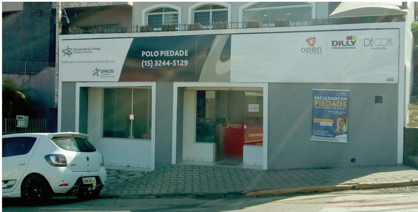
Unidade da Universidade Cruzeiro do Sul em Piedade fica localizada na Avenida Coração de Jesus, 237, Vila Olinda, junto ao Open Coworking

Piedade agora possui um pólo da Universidade Cruzeiro do Sul. As vagas estão abertas para o segundo semestre de 2018. Todos os cursos disponibilizados pela instituição estão enquadrados na modalidade Educação a Distância (EAD), com mensalidades a partir de R$ 149,00. A Universidade possui nota máxima no MEC em cursos a distância. Além das graduações, o pólo oferece pós-graduação, cursos livres e técnicos.