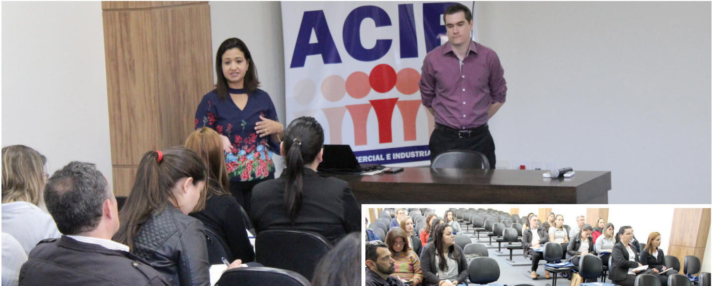
Evento esclareceu questões referentes a programas de estágios

O Auditório “Helmut Kurt Schneider”, da Associação Comercial e Industrial de Piedade (ACIP), recebeu, no dia 19 de junho, palestra do Centro Integração Empresa-Escola (CIEE). O evento esclareceu questões referentes a programas de estágios. Mais de 20 representantes de empresas locais participaram da palestra.