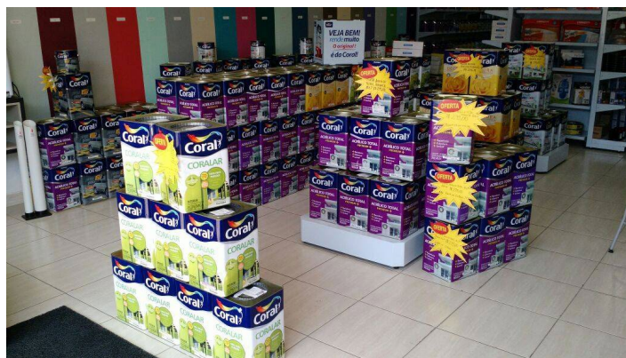
Loja é representante da marca Coral no município; a empresa, em funcionamento desde maio, está localizada na Rua Marechal Floriano Peixoto, 267, Centro

A Adroaldo Tintas conta com três funcionários e seu horário de funcionamento é de segunda a sexta-feira, das 8h às 18h, e aos sábados, das 8h às 17h. A loja fica localizada na Rua Marechal Floriano Peixoto, 267 – Centro. Além da linha de tintas, o comércio trabalha com itens para acabamento, papel de parede, acessórios e postes padrão. Outras informações podem ser obtidas pelo telefone: (15) 3344 – 2995.