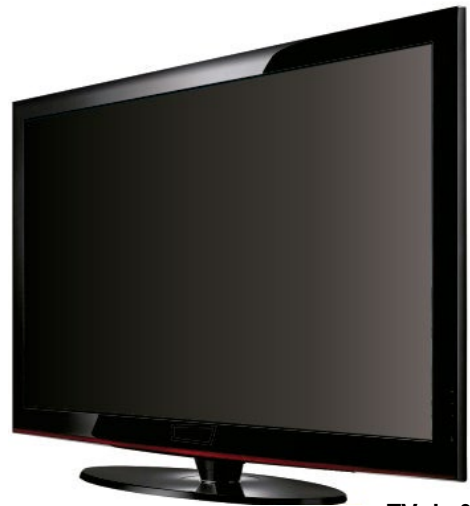
TV de 32"