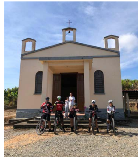
Capela Santo Antonio, Bairro da Serra