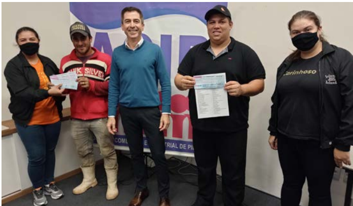
Presidente da ACIP entrega vale-compras e TV de 40 polegadas aos ganhadores da Campanha Cupom Premiado 2022