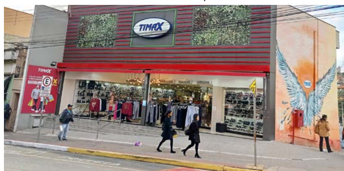
Loja Timax está localizada no Centro de Piedade

A Associação Comercial e Industrial de Piedade (ACIP) ouviu comerciantes que também comprovam um aumento nas vendas similar aos anos anteriores à pandemia.