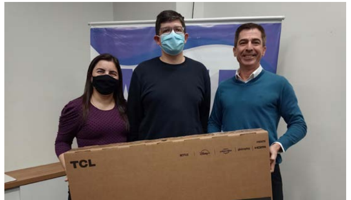
Presidente da ACIP entrega vale-compras e TV de 40 polegadas aos ganhadores da Campanha Cupom Premiado 2022