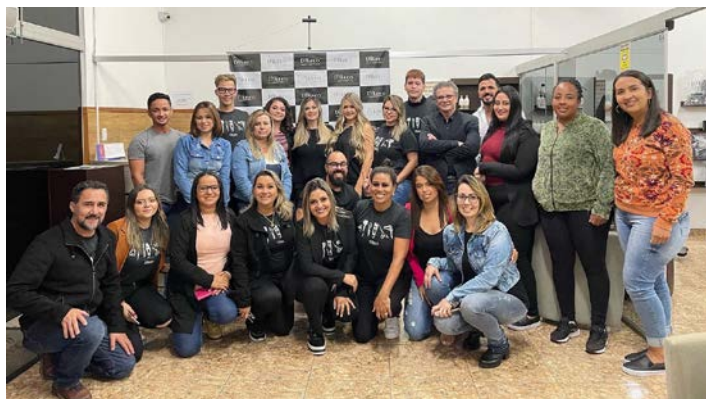
Grupo de profissionais participaram do Workshop