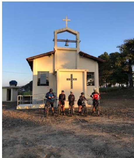
Capela da Santa Cruz, Bairro dos Buenos