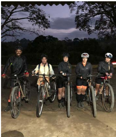
Peregrinação começava bem cedinho, às 5h

Interessados em visualizar e fazer a Rota das Capelas, podem ter acesso através do aplicativo Strava.