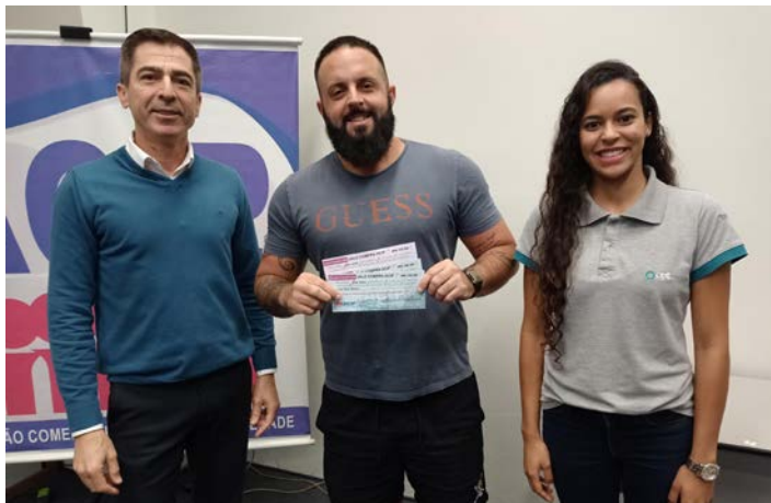
Presidente da ACIP entrega vale-compras e TV de 40 polegadas aos ganhadores da Campanha Cupom Premiado 2022

Sérgio destacou a importância desta ação para o comércio piedadense e agradeceu todos os ganhadores e lojas parceiras da campanha.