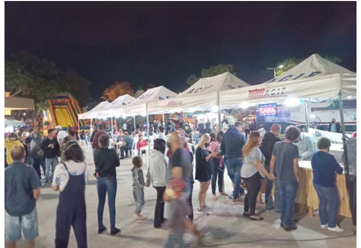
Tradicional Feira Noturna é promovida todas às sextas, na Praça de Eventos da Rodoviária

A Feira Noturna dos Produtores de Piedade se tornou um ponto de encontro de amigos e familiares. Prestígio.