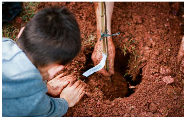
Evento teve mega plantio de mais de 350 mudas de árvores

municípios, que contabilizou mais de 120 unidades doadas, dentre Pessegueiros do Mato, Araçás Vermelhos e Roxos, Patas-de-Vacas etc.