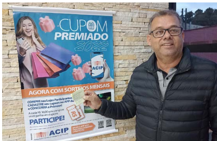
Diretor Edno realizou sorteios dos cupons