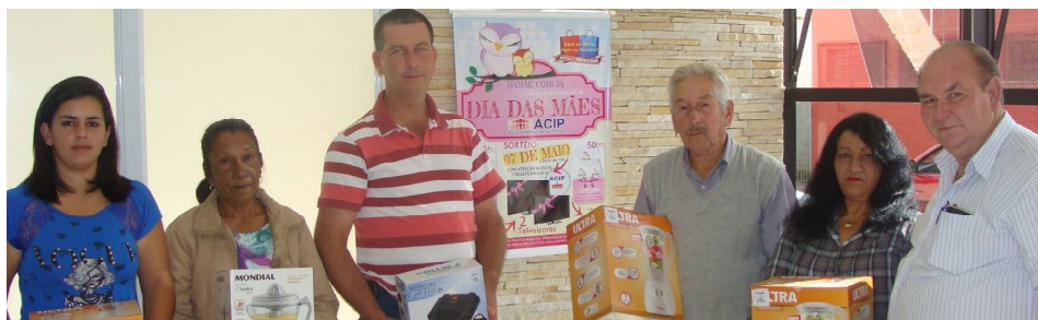
Ganhadores da Campanha do Dia das Mães que não compareceram na Praça no dia dos sorteios recebem prêmios na Sede da Associação Comercial e Industrial de Piedade