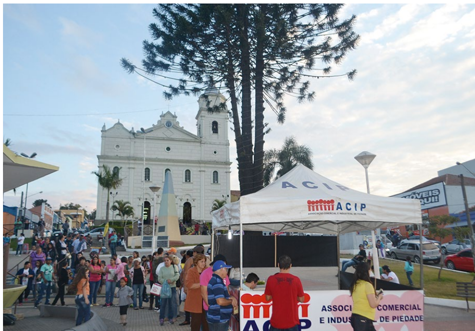
Evento reúne grande público na Praça da Matriz