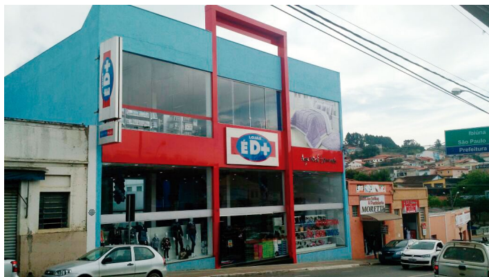
Loja, que está localizada na região central de Piedade, oferece variedade em produtos