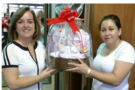
Mais de 50 Kits Mamãe Coruja entregues pelos lojistas