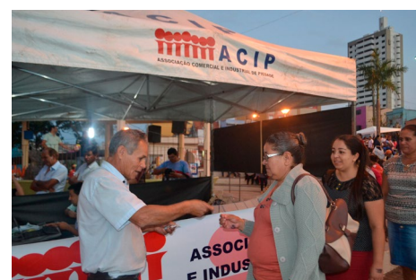
ACIP distribuiu senhas para o público concorrer aos brindes