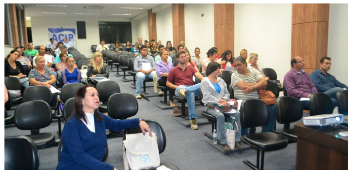
Lojistas e empresários de vários segmentos do comércio local participam da palestra

“Estamos num mundo de incertezas, mas precisamos buscar estabilidade”, assegurou. Ainda foram destacadas algumas das principais características do comportamento de um empreendedor, são elas: planejar ações, estabelecer metas, ter comprometimento, ser persistente, eficiência e persuasivo e adquirir redes de contatos.