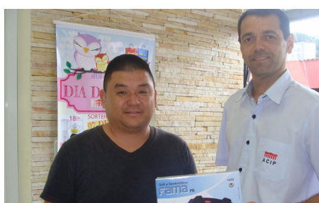
Mais um ganhador