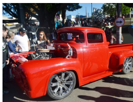
Presidente da ACIP, prefeita de Piedade, autoridades municipais e organizadores no ato de início do evento; grande público prestigiou a exposição