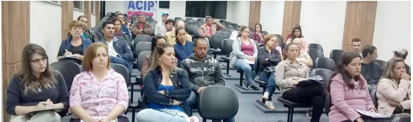
Dois importantes eventos promovidos pelo SEBRAE e ACIP na semana do empreendedor reúne lojistas do comércio piedadense