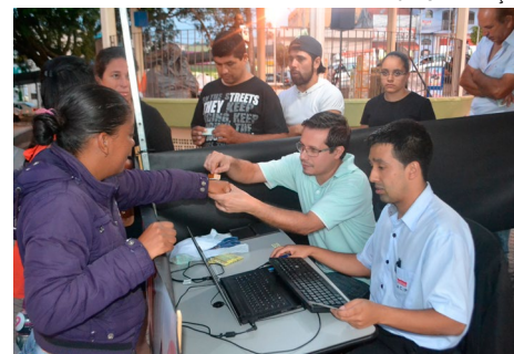
Carimbo nas mãos dos participantes para concorrer à TV de 32"