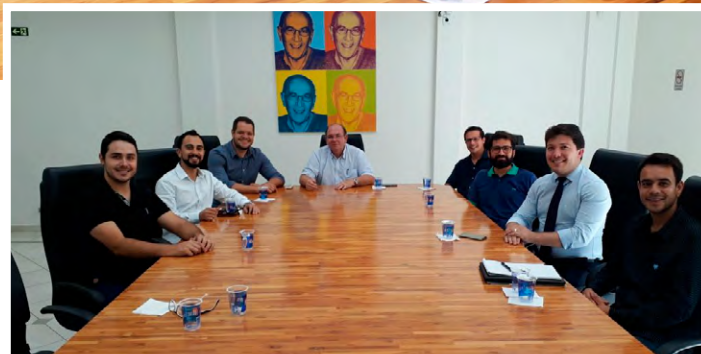
ACIP e representantes da futura Associação Comercial de Salto de Pirapora

Já os empresários de Salto de Pirapora solicitaram informações junto à ACIP, uma vez que estão em fase de constituição de uma Associação naquela cidade. Eles perguntaram sobre a estrutura da entidade, as campanhas e cada serviço oferecido aos associados. Ainda tiraram dúvidas sobre o setor administrativo e área comercial.