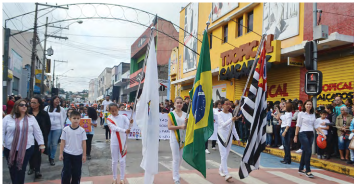
Desfile Cívico das Escolas Municipais