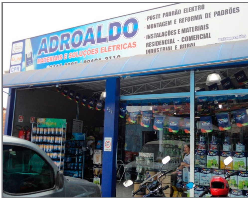
Loja está localizada na Rua Capitão Moraes; empresa também iniciou no ramo de tintas