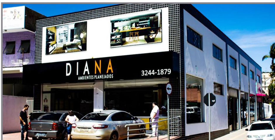
Loja está localizada na Avenida Raimundo Nonato Leite; abaixo, espaços com móveis planejados