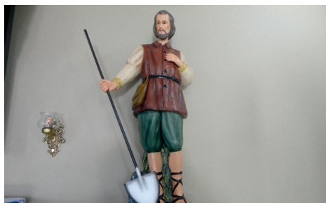
Imagem de Santo Isidoro