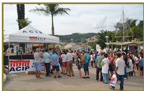
Expectativa da Campanha é de atrair grande público na Praça