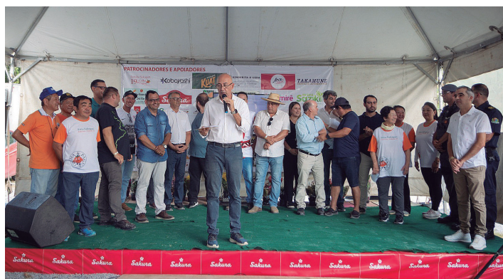
Presidente da ACIP esteve na abertura do evento junto com autoridades municipais e organizadores da festa