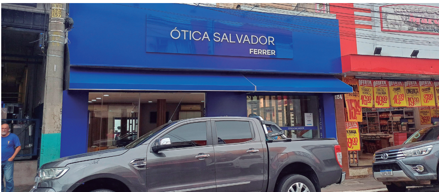
Ótica Salvador está localizada na Rua Araújo Leite, nº 130 - Centro

A Ótica Salvador está localizada na Rua Araújo Leite, nº 130 - Centro. Telefone para contato (15) 99759-8025, siga no Instagram @otica.salvador_ferrer