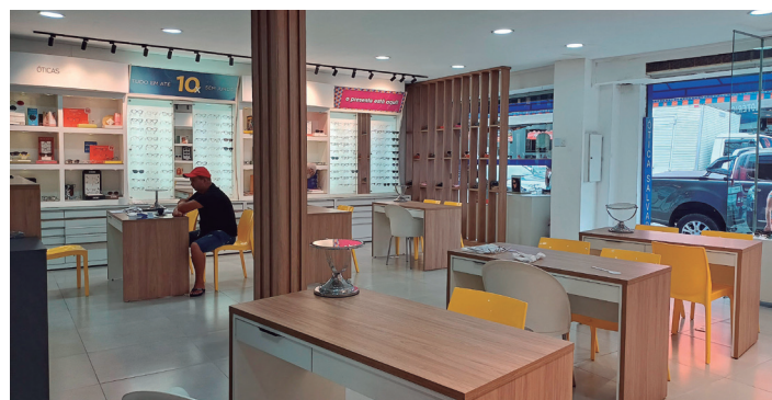
Recentemente, a empresa ampliou a variedade de marcas e tornou os preços ainda mais acessíveis