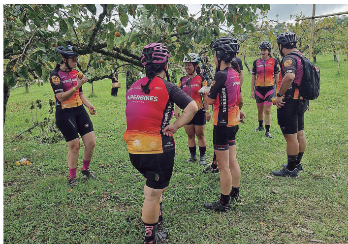
Turistas de várias regiões vivenciam a experiência de colher e saborear o caqui no próprio pomar