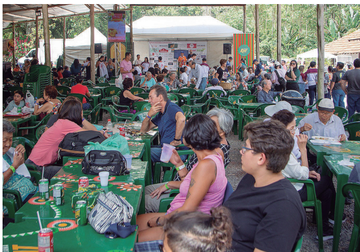
Pratos típicos da culinária japonesa encantam os visitantes no espaço gastronômico do evento