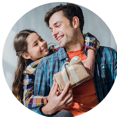
Mês dos Pais