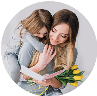
Mês das Mães