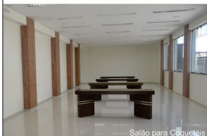
Salão para Coquetéis