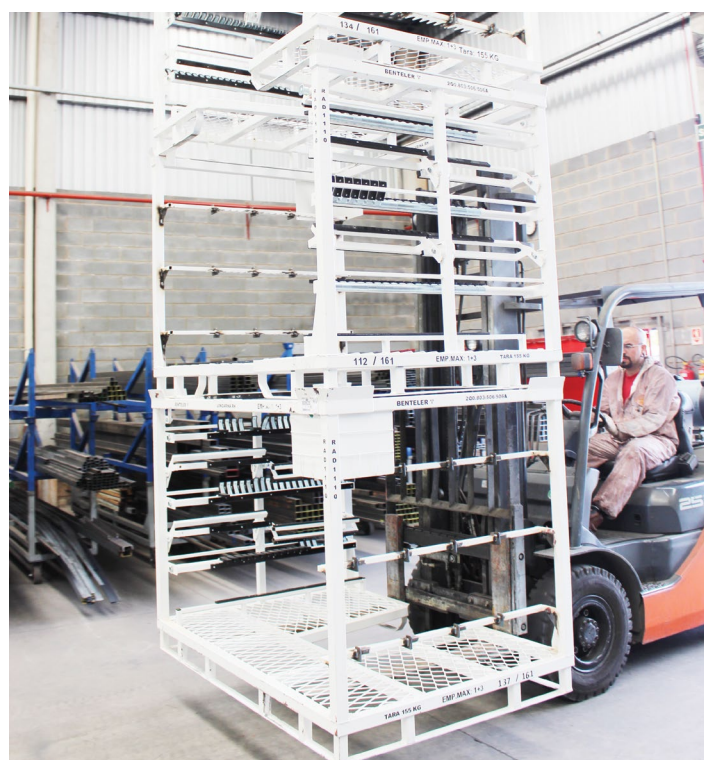
Empilhador separa devidamente os produtos