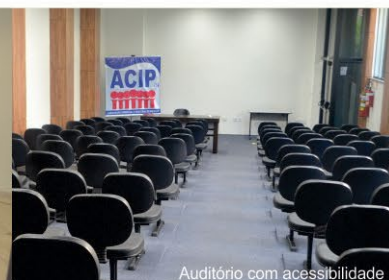
Auditório com acessibilidade

Rua Cônego José Rodrigues, nº 63 - Centro - Piedade SP