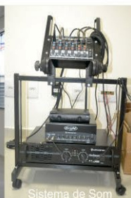
Sistema de Som