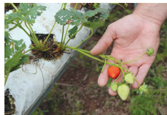
Produção de morango

É feita análise residual, onde é coletada uma amostra da produção do grupo de produtores e é levada ao laboratório para verificar se não há resíduos de agrotóxicos. A amostra escolhida responde por todo o grupo. O responsável técnico interno faz os relatórios mensais que passam por auditoria externa para finalização.