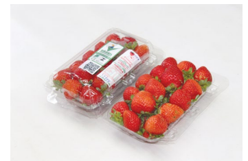
Morangos já embalados para venda