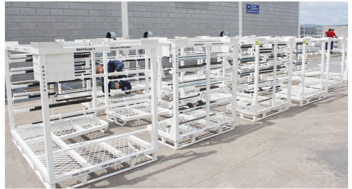
Produção de racks para indústrias

A Acacia está localizada na Rodovia SP 79, km 114,5, Bairro Boa Vista, Piedade.