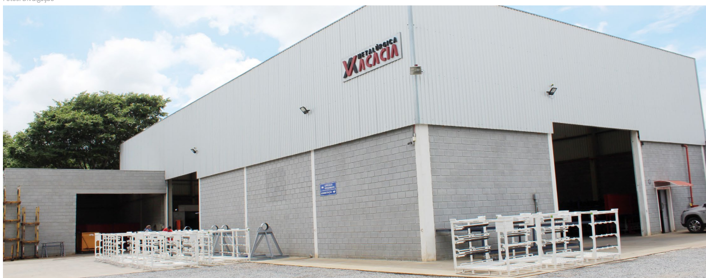
Fachada da metalúrgica Acacia

Com pouco mais de cinco anos em atividade no município, a Acacia Produtos Metalúrgicos é um exemplo de que é preciso acreditar nos sonhos e que grandes conquistas somente são alcançadas com planejamento, muito trabalho, determinação e persistência.