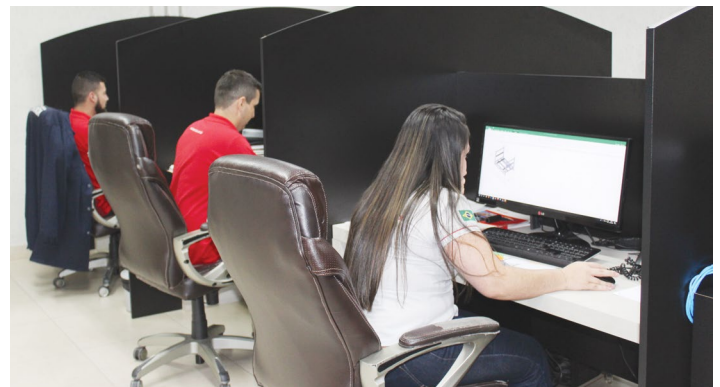
Setor administrativo e comercial