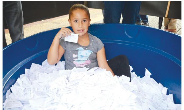
Campanha preparada pela ACIP prevê sorteios de diversos prêmios