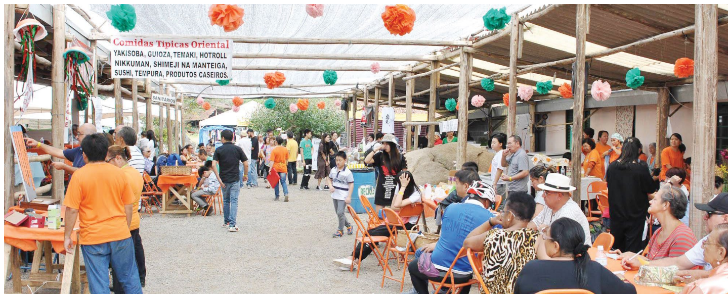
Praça de Alimentação

A 13ª edição do Colha e Pague Kaki Fuyu inicia dia 23 de março e prossegue até o dia 21 de abril, no Sítio da Família Sakaguti. É considerado um dos principais eventos ligados ao turismo rural do município. Conta com jardim de flores, artesanatos, pratos típicos japoneses, Museu da Família Sakaguti e muito mais. É sucesso desde as edições anteriores e atrai muitos turistas para Piedade.