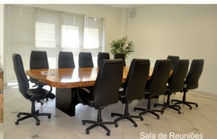
Sala de Reuniões