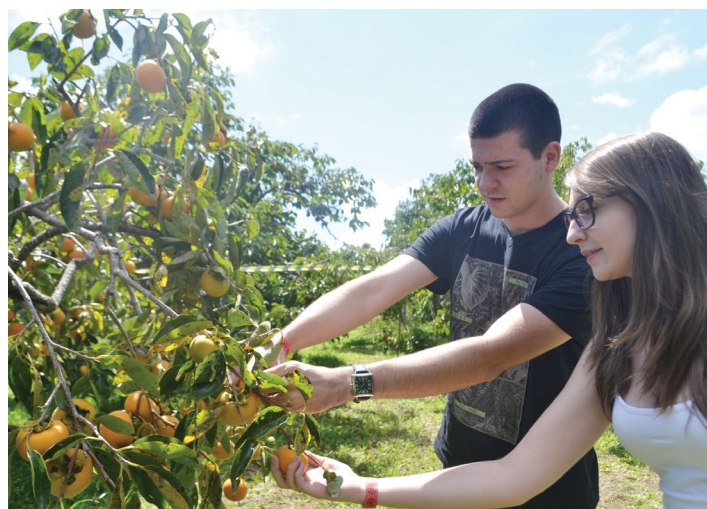
Colha e Pague Kaki Fuyu atrai turistas