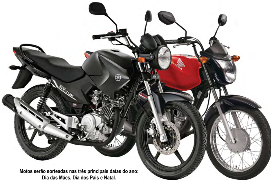
Motos serão sorteadas nas três principais datas do ano: Dia das Mães, Dia dos Pais e Natal.