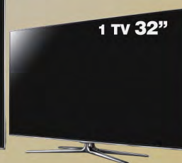
1 TV 32"