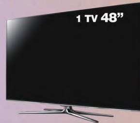
1 TV 48"