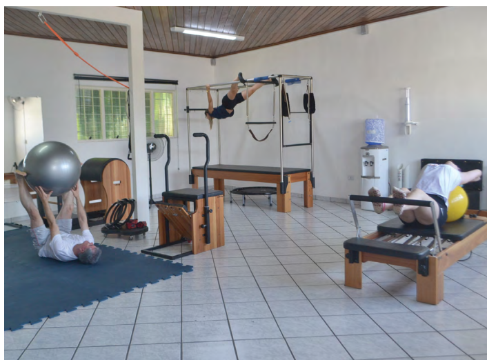
Método pilates pode reverter quadros de casos de pessoas que necessitam de cirurgias

Empresa aplica método que age na diminuição de dores e reabilitação física