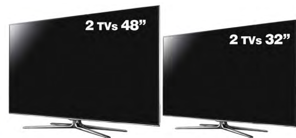
O sorteio dos televisores ocorre em 13 de março e no dia 12 de agosto.

Mais uma vez a Associação Comercial e Industrial de Piedade (ACIP) inova na promoção de campanhas que fortalecem e impulsionam as vendas no comércio do município. Após sucesso da ação promovida em 2016 que sorteara duas motos como principais prêmios, este ano a Associação sorteará sete motos zero quilômetro, além de quatro TVs. A campanha continuará com o slogan Aqui eu Moro, Aqui eu Compro - já conhecido e aprovado pelos lojistas e consumidores - e promoverá o tema Compra Premiada.