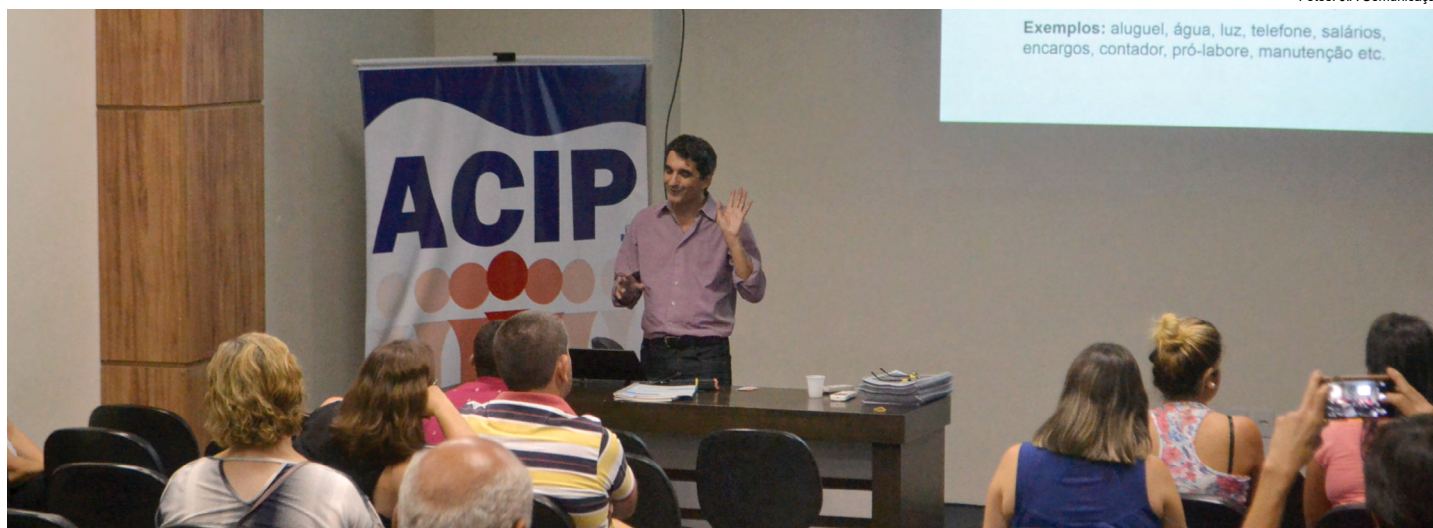
Evento foi marcado pela presença de aproximadamente 30 empresários

A Associação Comercial e Industrial de Piedade (ACIP) recebeu uma oficina de fluxo de caixa, no dia 23 de fevereiro, no auditório "Helmut Kurt Schneider". O evento, destinado aos empresários do município, tinha como objetivo a orientação dos participantes em relação ao uso da ferramenta de fluxo de caixa no gerenciamento empresarial. Foram 30 vagas disponibilizadas aos gestores interessados e todas foram preenchidas.