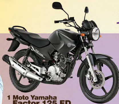
1 Moto Yamaha Factor 125 ED