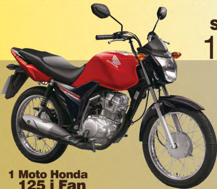
1 Moto Honda 125 i Fan

As imagens vinculadas são meramente ilustrativas.