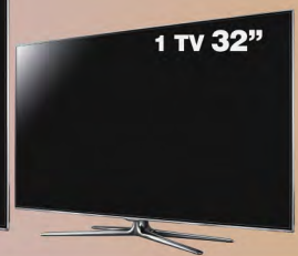
1 TV 32"

As imagens vinculadas são meramente ilustrativas.