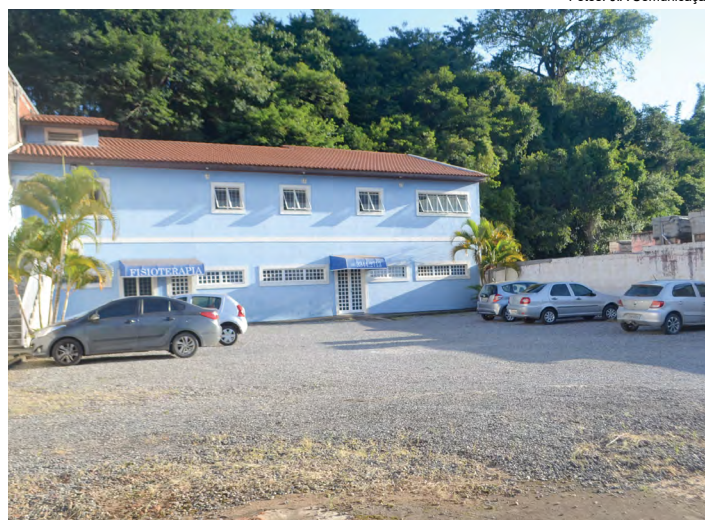
O Stúdio Pilates conta com ampla estrutura e equipamentos de última geração