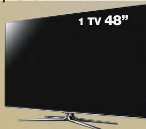
1 TV 48"