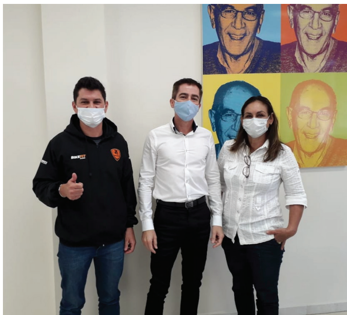
Presidente da ACIP e representantes da Ciclorotas

Para conhecer mais sobre a Ciclorotas, acesse www.facebook.com/ciclorotaspiedadesp ou entre em contato pelo email ciclorotaspiedade@outlook.com ou telefone 15 98147-0221