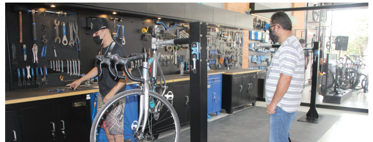
Nova oficina é três vezes maior que a unidade anterior