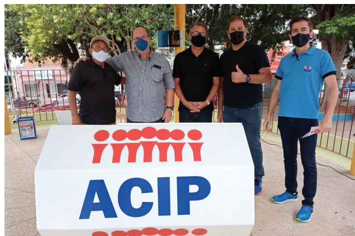
Presidente e diretores da ACIP