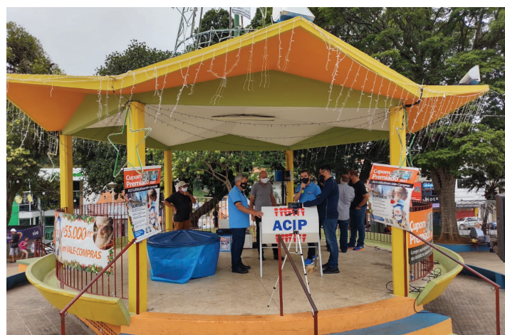
Sorteio foi realizado no Coreto da Praça da Matriz