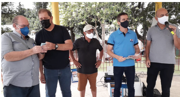
Diretores conferiram todos os cupons sorteados