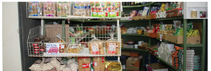
Variedade de produtos para culinária oriental