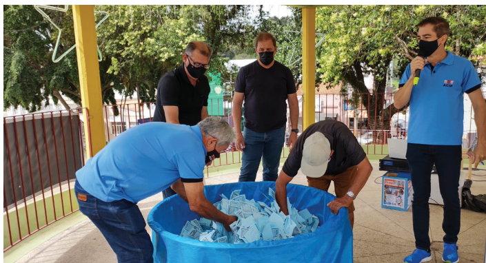
Cupons sendo sorteados