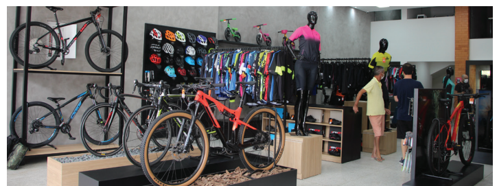
Loja ampla e moderna para melhor atender os clientes