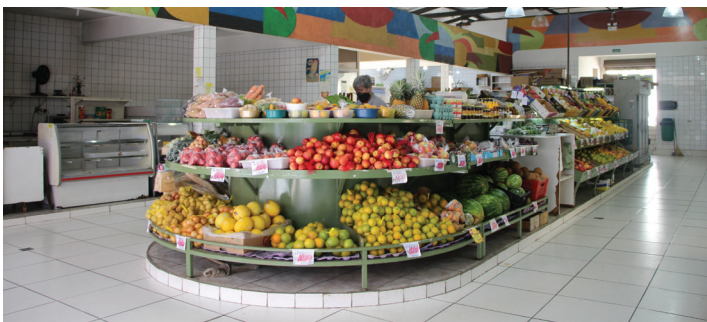
Mercado Municipal possui grande variedade de frutas, legumes e verduras fresquinhas