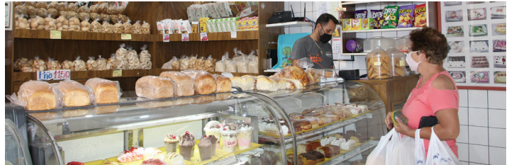
Padaria Almeida oferece todos os tipos de doces típicos de padaria e pães de fabricação caseira