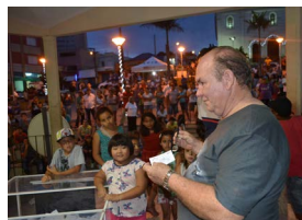
Presidente da ACIP e representante da prefeitura entregam prêmios aos ganhadores do Concurso de Decoração de Natal