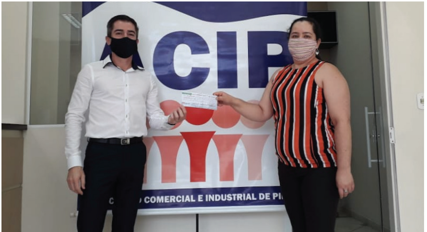
Diretor da ACIP e ganhadora do sorteio do App ACIP Piedade