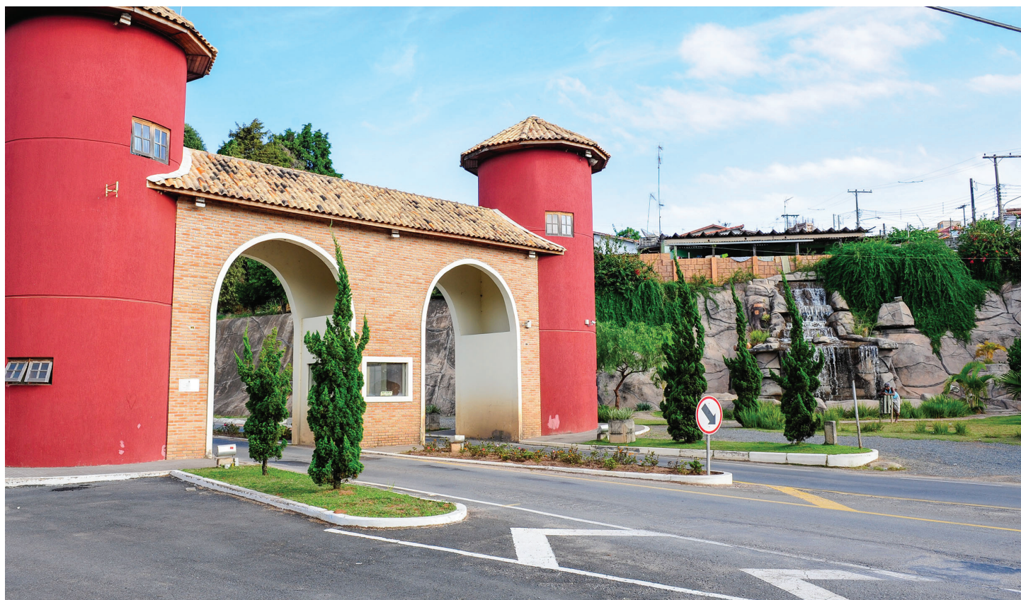
Portal das Águas é um dos pontos turísticos de Piedade