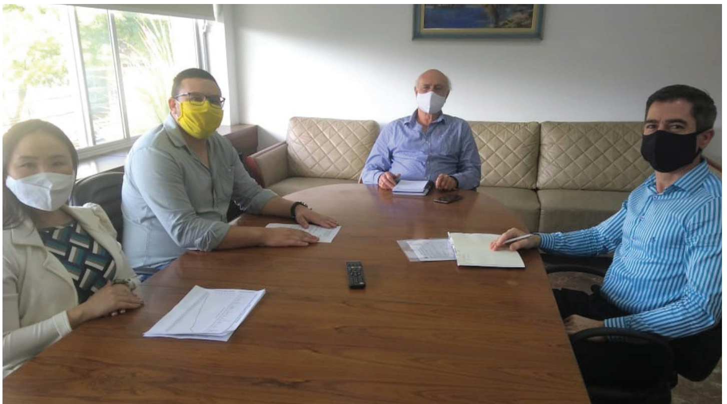
Presidente da ACIP se reúne com Comitê do COVID-19