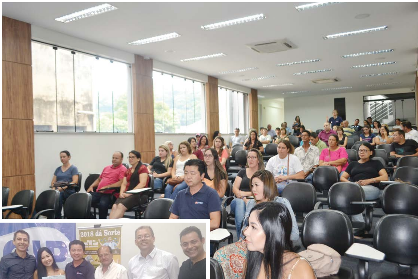
Auditório da ACIP com os ganhadores dos prêmios

dos ganhadores e de representantes das empresas participantes da campanha. A entrega dos prêmios foi referente aos sorteios de 50 vales-compras de R$ 500,00, dois vales-compras de R$ 5.000,00 e um vale-compra no valor de R$ 10.000,00.