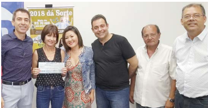
Entrega de um dos prêmios de R$ 500,00