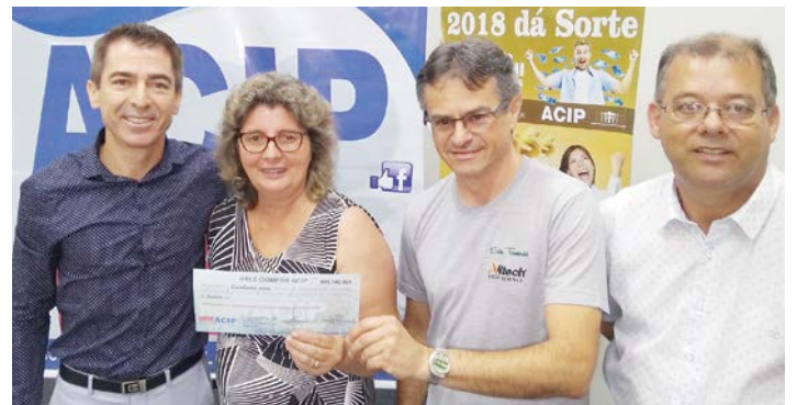
Uma das ganhadoras do prêmio de R$ 500,00