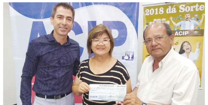
Ganhadora do prêmio de R$ 5.000,00