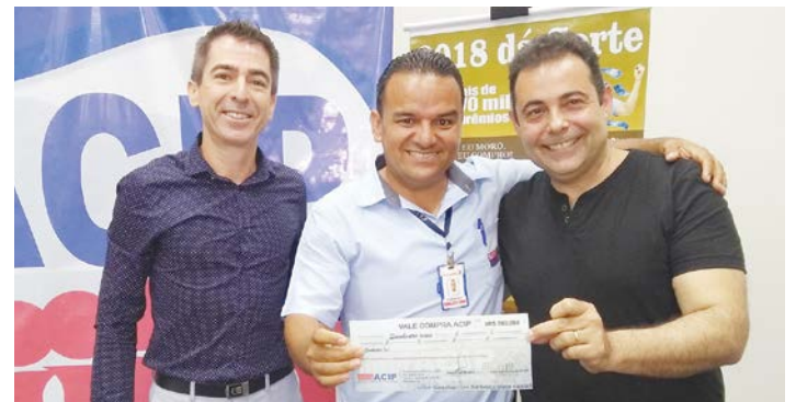
Um dos ganhadores do prêmio de R$ 500,00