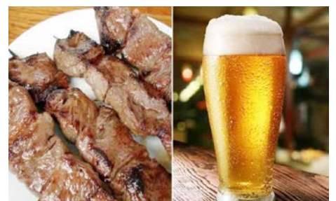
Local conta com venda de espetinhos e Chopp