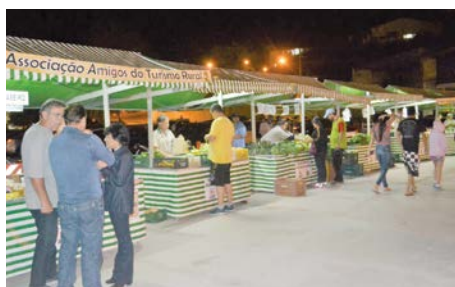
Barracas de turismo e produtos agrícolas