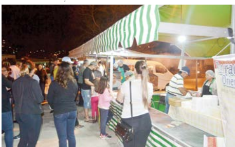
Barracas da Praça de Alimentação