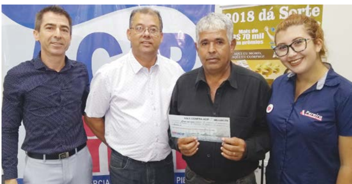
Ganhador do prêmio de R$ 5.000,00