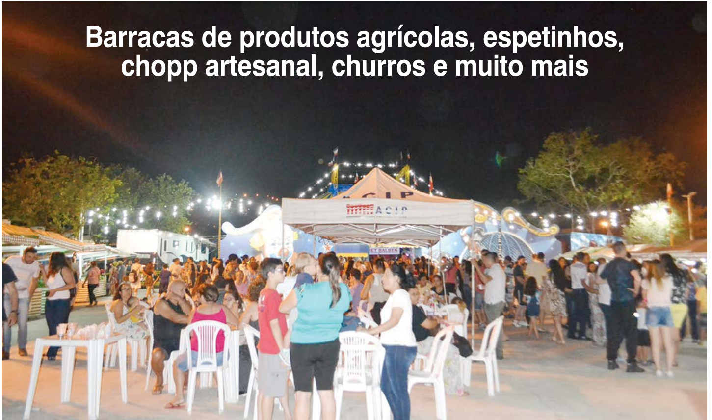
Feira atrai grande público todas às sextas-feiras

Barracas de produtos agrícolas, espetinhos, chopp artesanal, churros e muito mais